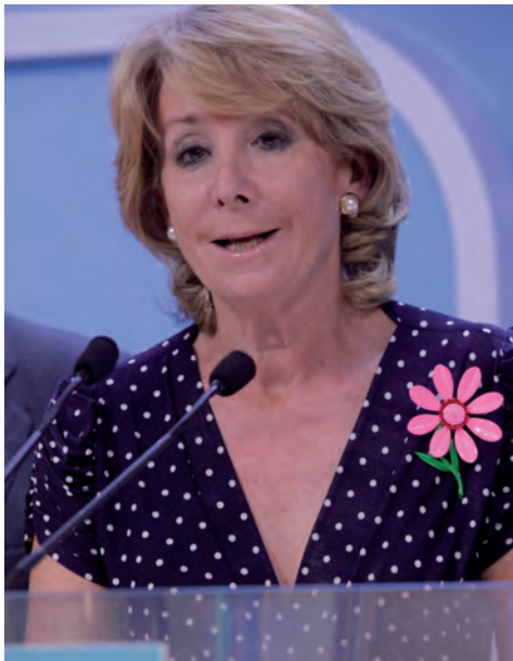
Aguirre sigue peleando.

El secretario de Organización del PSOE, Marcelino Iglesias explicaba en rueda de prensa el proceso de asambleas locales celebradas en las últimas semanas, alrededor de 4.100, y de los 55 "congresillos" provinciales del fin de semana, que han elegido a los 956 delegados que participarán en el cónclave sevillano con voz y voto. ●