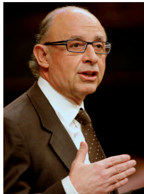
Las tijeras de Montoro, al alza.

Comienzo de año y de Gobierno. Tanto el presidente Rajoy como los principales miembros de su Ejecutivo, con la vicepresidenta Soraya Sáenz de Santamaría a la cabeza, acaparan los primeros puestos del panel de influencia de EL SIGLO. Ante un PSOE 'en reconstrucción' y los líderes autonómicos en un segundo plano, sólo los banqueros logran restar protagonismo a un elenco de ministros con mucha tarea por delante. En el primer partido de la oposición, a pocos días del congreso que elegirá a su próximo secretario general, nuestros panelistas parecen creer por sus votaciones que Alfredo Pérez Rubalcaba parte con ventaja.