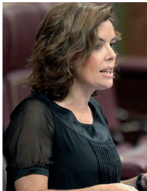
Soraya acapara mucho poder.

La segunda tendrá que llevar a buen puerto ni más ni menos que la complicada reforma laboral que parecen esperar los mercados europeos. Y Ruiz-Gallardón aparece de subida no tanto por los retos que afronta su departamento, que sin lugar a dudas los tiene,