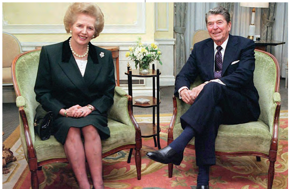
Bajo los gobiernos de Thatcher y Reagan la brecha comenzó a ensancharse en el Reino Unido y Estados Unidos. EFE

Otro fenómeno llamativo es que “en los hogares con parejas, las esposas de los que más ganan son aquellas cuyas tasas de empleo más crecieron”. De hecho, también ha habido en todos los países un aumento en el fenómeno conocido como “emparejamiento selectivo”, es decir, “las personas con los ingresos más altos eligen a sus cónyuges en la misma horquilla de ingresos. Es decir, los médicos se casarían con otros médicos, en lugar de con enfermeras. Hoy en día, en el 40 por ciento de