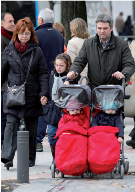
Los cambios en los modelos de familia han influido.

que también aumentan el valor de las habilidades. Los avances en la tecnología, por ejemplo, están detrás de la fragmentación de las actividades económicas y la deslocalización de la producción”.