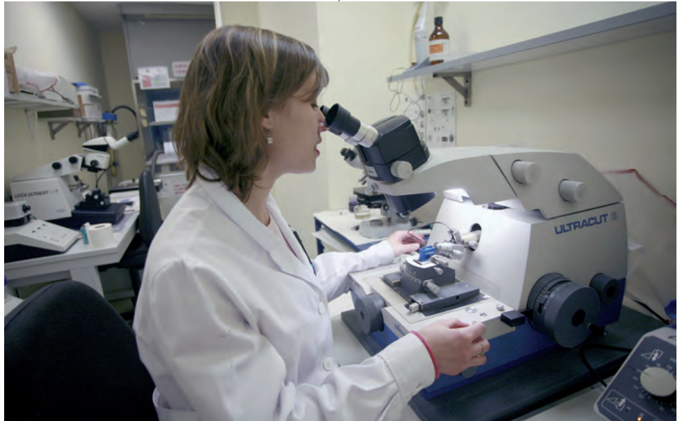
La evolución tecnológica ha beneficiado a los trabajadores cualificados.

Todas estas tendencias han contribuido a aumentar la desigualdad de los ingresos de los hogares en las últimas décadas. Es más, según la OCDE, “algunos observadores incluso consideran los cambios en la formación de las familias la principal razón de la creciente desigualdad. Así, el aumento de las familias monoparentales sería responsable de gran parte del crecimiento de la desigualdad en los Estados Unidos, mientras que varios estudios también sugieren que la correlación de crecimiento de los ingresos de los cónyuges en los hogares con parejas contribuye significativamente al aumento de la desigualdad”. Es importante tener en cuenta el efecto de estos cambios demográficos, hasta cierto punto modesto, según la OCDE, junto con el im-