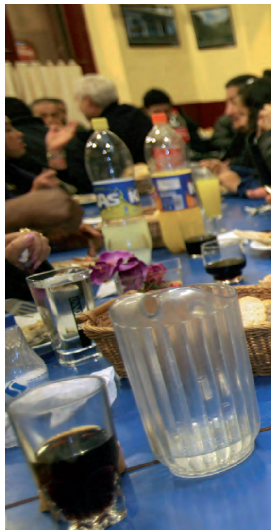
Los ingresos de los hogares más ricos crecieron un 10% más rápido

La situación es tan generalizada en las principales economías que supone que, en 2008, al comienzo de la crisis, "en los países de la OCDE, el ingreso medio del 10 por ciento más rico de la población es aproximadamente nueve veces superior al del 10 por ciento más pobre". Sin embargo, la proporción varía mucho de un país a otro. Por ejemplo "es mucho más baja que la media de la OCDE en los países nórdicos y llega, por ejemplo, a alcanzar