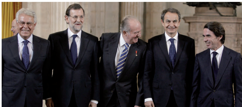
González, Rajoy, Don Juan Carlos, Zapatero y Aznar posan en el acto de entrega del Toisón de Oro a Sarkozy.

La entrega del Toisón de Oro a Nicolas Sarkozy reunió a Mariano Rajoy y a sus últimos tres antecesores en el cargo, Felipe González, José María Aznar y un José Luis Rodríguez Zapatero que comparecía por primera vez en un acto público ejerciendo de ex, o como dijo en su momento el propio Felipe González, como "jarrón chino", que es lo que les sucede a los expresidentes según él: que todo el mundo les